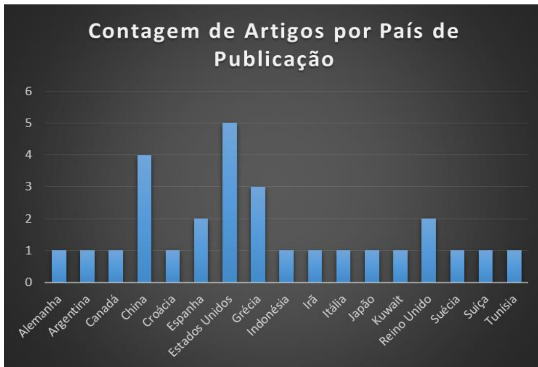
Gráfico 2: Quantidade de artigos selecionados por país de publicação.

A partir do Gráfico 2 é possível perceber também que a adoção de SOA em SIS não é apenas uma ocorrência localizada, mas sim um fenômeno global. É importante destacar também a participação pouco expressiva de países da América Latina.