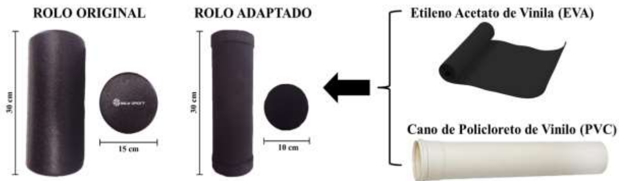
Figura 1. Rolos utilizados para realização da técnica de Auto Liberação Miofascial

A técnica de ALM foi realizada simultaneamente no GRO e GRA, aplicada apenas uma vez em cada membro. Os locais de interesse foram massageados de forma bilateral sendo eles: Piriformes, Isquiotibiais, Banda Iliotibial, Quadríceps, Adutores, Gastrocnêmicos e Coluna Lombar e Torácica. O tempo de estímulo sobre cada região foi de 30s de trabalho e 15s pausa, sendo feito apenas uma única vez em cada ponto. O tempo para realização da técnica, incluindo a recuperação, totalizou aproximadamente dez minutos. A ALM foi aplicada com uma fricção sobre o local, utilizando a própria massa corporal do estudante para estimular o local desejado. Os escolares foram instruídos a começar a massagem na parte mais distal, exercendo uma pressão sobre a região pretendida.