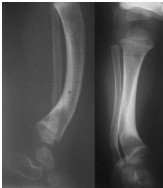
Figura 2 - Tíbia e fíbula com convexidade anterior e espessamento cortical posterior

taram arqueamento semelhante àquele observado na tíbia e na fíbula.