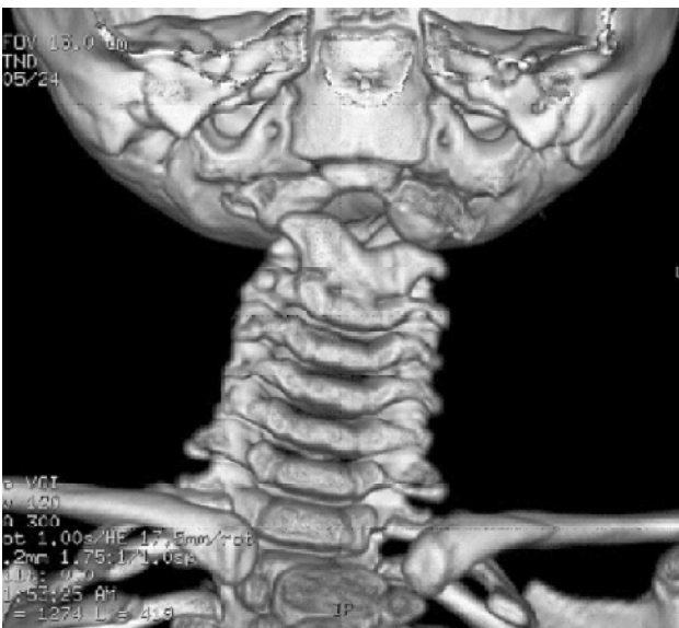
Figura 4 - Reconstrução da tomografia (visão anterior) confirmando a occipitalização do arco hipoplásico anterior do atlas e hipoplasia odontóide e fusão das vértebras C2-C3