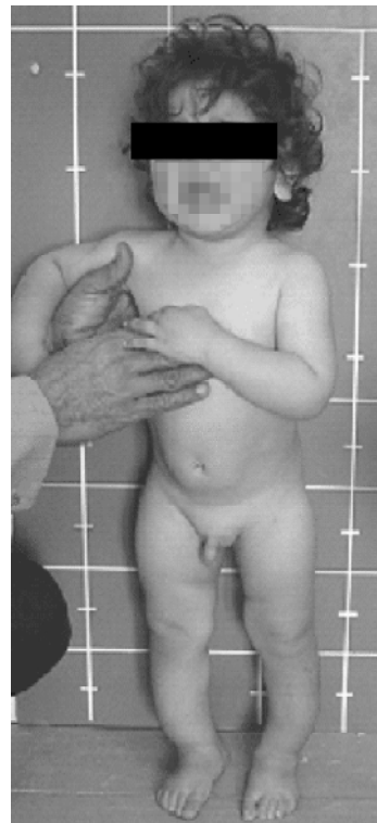
Figura 1 - Arqueamento bilateral das pernas

Os raios X dos membros inferiores (Figura 2) mostraram arqueamento da tíbia e da fíbula com convexidade anterior e o ápice da curva encontrava-se na junção dos terços médio e inferior. Havia distorção do padrão trabecular da cavidade medular do eixo médio, e observou-se espessamento cortical posterior. Outros ossos longos não apresen-