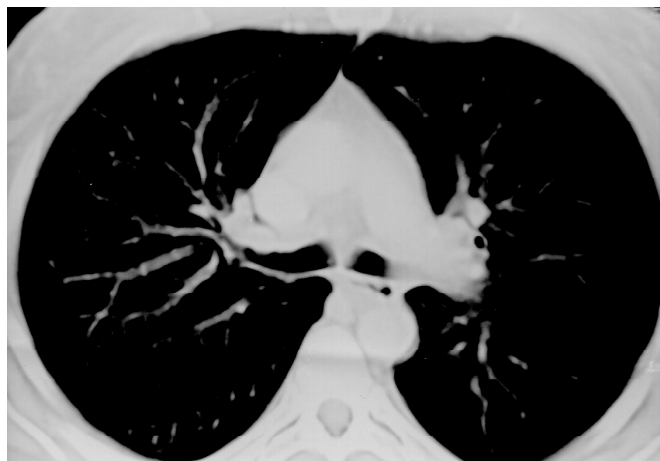
Figura 3 – Tomografia computadorizada de tórax

A radiografia simples de tórax mostrou infiltrado retículo-nodular em metades inferiores dos pulmões e sinais de fibroatelectasia em lobo superior direito (Figura 1). Gasometria arterial em repouso, sentada, demonstrou hipoxemia grave, com pH = 7,49, PaO 2 = 52mmHg, PaCO 2 = 21,3mmHg, SaO 2 = 89%. Demais exames laboratoriais evidenciaram plaquetopenia (28.000/mm 3 ), leucopenia (leucócitos totais = 5.300cél/mm 3 ) e alteração de provas de função hepática, com TP prolongado, hipoalbuminemia (2,1mg/dL) e hiperbilirrubinemia (BT = 15,5mg/dL). Também demonstrou-se elevação de enzimas hepáticas, com alanina aminotransferase (ALT) de 162UI/L e aspartato aminotransferase (AST) de 72UI/L. HDL sérica = 267U/L (normal 210-425U/L).