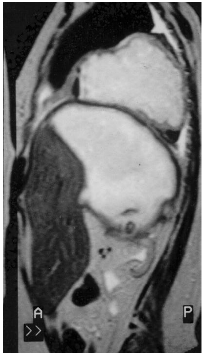
Figura 2 – Ressonância magnética (plano sagital): observar fígado rechaçado anteriormente pelo grande abscesso retroperitoneal, abscesso pulmonar e derrame pleural.