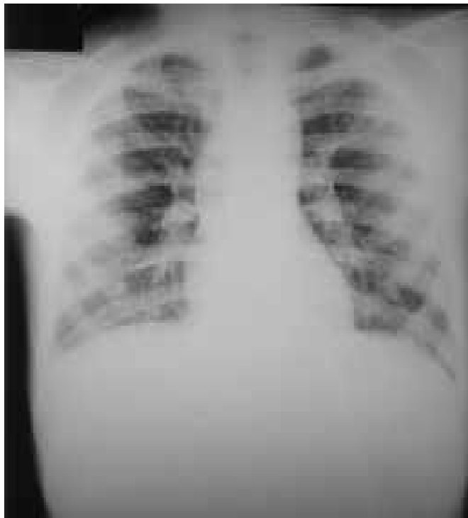
Figura 3 – Pneumonia por Chlamydia psittaci . Radiografia de tórax do paciente em alta hospitalar, mostrando melhora significativa do quadro pulmonar.

tato com pássaros, o qual é relatado em até 85% dos casos. Essa é a informação de maior valor diagnóstico à admissão (4,5) . Exposições breves com aves também podem causar infecção sintomática e, em 15% dos casos, não se registra qualquer tipo de contato com esses animais. A Chlamydia psittaci infecta pássaros e animais domésticos, sendo excretada em grande número nas fezes, urina, secreções, saliva e penas (8,10,11) . A doença em humanos é adquirida pela inalação do microrganismo presente nas secreções ou fezes secas dos pássaros infectados (2-4,8) . Outras maneiras de transmissão incluem bichadas, contato boca-bico, manuseio de penas e tecidos infectados. Pássaros recém-adquiridos representam importante modo de infecção, pois a doença nesses animais pode ser induzida por situações de estresse, como fome, superlotação, transporte e maus tratos. Se não tratadas, 10% das aves infectadas tornam-se portadoras assintomáticas. Transmissões inter-humanos são extremamente raras e tendem a ser mais graves (9) . A Chlamydia psittaci pode também infectar ovelhas, bodes e gado, causando infecção crônica no aparelho reprodutivo, insuficiência placentária e aborto nesses animais, mas a contaminação humana pela ingestão da carne infectada é rara (2,5) .