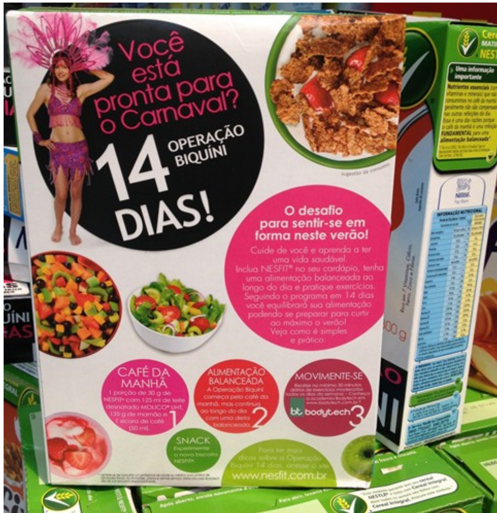
Figura 4 – Verso da embalagem dos produtos Nesfit

Na Figura 4, verso das embalagens de cereais matinais da linha Nestlé Nesfit , há alguns outros aspectos relevantes a serem analisados. Há uma mescla maior entre elementos escritos e imagens e várias molduras que interconectam textos escritos e imagens. No canto superior direito, emoldurada por um círculo preto, vemos a imagem de uma mulher vestida com uma fantasia de carnaval, como o texto ao lado da imagem sugere. Essa mulher foi fotografada a uma distância social longa ( long shot ), revelando seu corpo todo. Alguns motivos podem explicar a distância. Não se trata de uma pessoa famosa e que fale diretamente com as consumidoras, como é o caso da imagem de Paola Oliveira. No entanto, o fato de a imagem ser frontal, objetiva, o vetor do olhar formar um ângulo reto com as pessoas que olham a imagem, a postura corporal ereta e o sorriso revelam que a mulher da imagem se comunica de alguma forma com suas