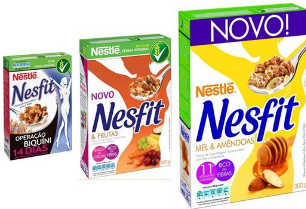
Figura 2 – Frente da embalagem dos produtos Nesfit

Na Figura 2, vemos três embalagens do mesmo produto da linha Nesfit . Em destaque, formando um ângulo oblíquo com as demais, aparece uma embalagem que coloca em destaque, no alto da embalagem e em cor destacada, a palavra “novo” que sugere um diferencial do produto e uma forma de a marca demonstrar seu reposicionamento discursivo, com um novo compromisso em vender produtos em que a preocupação com a saúde e a boa forma sejam foco. Não há representações e nem processos narrativos em nenhuma das capas das embalagens, ou seja, por mais que o produto sugira as atividades físicas aliadas à alimentação saudável como chaves para alcançar o corpo “fit” 1 , não há representações nas embalagens de produtos que sugiram atividades físicas nem representem esses processos.