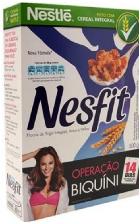
Figura 3 – Frente da embalagem dos produtos Nesfit

Aqui, “operação biquíni” remete a uma série de atitudes que deveriam ser tomadas por parte da consumidora em nome de, em apenas 14 dias, estar “apta” a utilizar um biquíni, ou seja, uma série de procedimentos invasivos e complexos estão sendo sugeridos às consumidoras em nome de elas alcançarem o ideal de um corpo digno de ser exposto. A palavra ‘biquíni’ remete não só à peça de vestuário utilizada por mulheres (e novamente elas, excluindo-se, pois, os homens como potenciais consumidores do produto), mas a todo um conjunto de atributos simbólicos valorizados em nossa sociedade: o corpo magro, a objetificação do corpo e os cuidados pessoais.