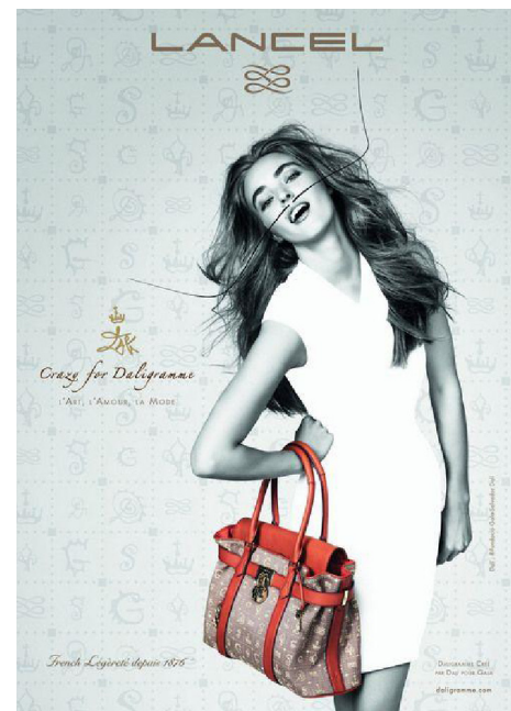
Figura 2. Lancel

O processo de incorporação em que é colocado o leitor dá primazia à dimensão experiencial do ethos, sublinhada pela personagem central, e à dimensão icônica. O enunciado colocado no canto inferior esquerdo (“French Légèreté desde 1876”) está a serviço desse ethos experiencial, que ele categoriza como “leveza”, uma noção que se aplica obviamente à enunciação desse iconotexto publicitário e a seu fiador, ou seja, a marca. Se na publicidade da Jet Tours havia divergência do ethos icônico e do ethos verbal, integrados a um nível superior, nessa publicidade da Lancel a convergência é total.