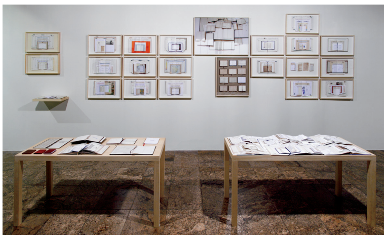
Figura 2 – Leila Danziger. Todos os dias de nossas vidas . Capas e páginas de agendas costuradas e objetos sobre mesas de madeira. Dimensões variáveis. Caixa Cultural, Rio de Janeiro, jan.-mar. 2015. Mostra coletiva Asas a Raízes . Curadoria de Sonia Salcedo Del Castillo.