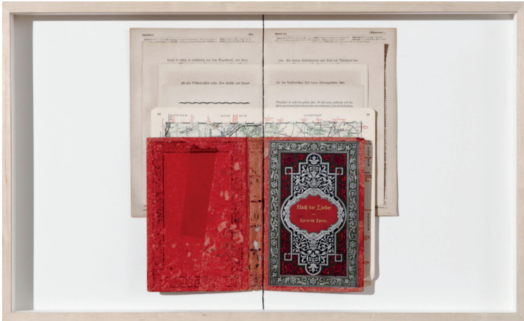
Figuras 4 e 5 – Leila Danziger. Bildung . 2014. Dezoito pranchas com páginas e capas de livros abertos e costurados, 98 livros dispostos sobre prateleira de madeira e 112 fotografias e documentos dispersos entre as páginas dos livros. 300 cm x 400 cm. Museu de Arte do Rio, Rio de Janeiro, ago. 2014-jan. 2015. Mostra Há Escolas que São Asas e Há Escolas que São Gaiolas. Curadoria de Paulo Herkenhoff e Janaína Melo.