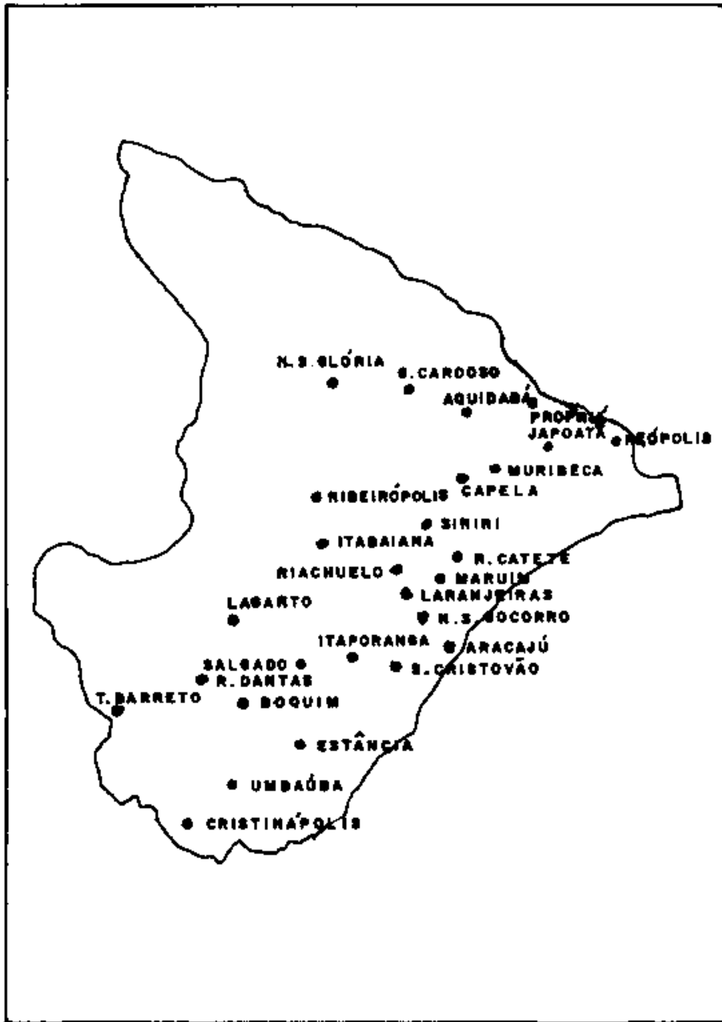
Fig. 1: localidades onde foram realizadas as coletas de Biomphalaria , no Estado de Sergipe.

As localidades onde foram realizadas as coletas de Biomphalaria estão assinaladas na Fig. 1.