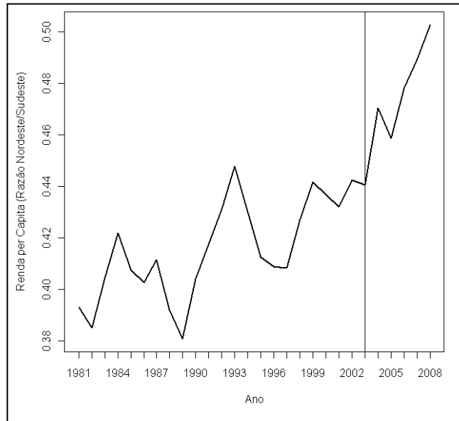
Figura 2 Varição da razão entre a renda per capita do Nordeste e do Sudeste