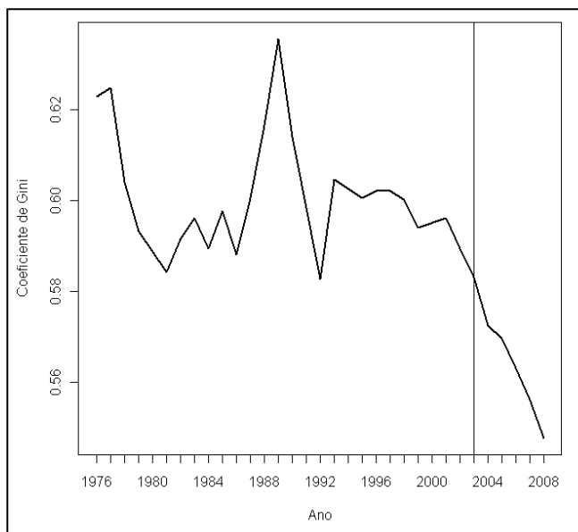
Figura 1 Evolução do índice de Gini no Brasil

governo. É suficiente notar que todos fizeram parte da agenda social do governo e que tiveram seus efeitos sobre a redução da pobreza somados em maior ou menor medida ao do Bolsa Família.