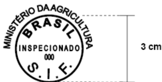
Figura 2. Selo da Inspeção Federal Modelo 3

O MAPA é o órgão federal responsável pela regulamentação dos queijeiros de coalho que produzem para o comércio interestadual e internacional. Antes de receber autorização legal para comercialização fora de determinado estado, o produto passa por várias etapas de fiscalização. A qualidade sanitária do queijo coalho é certificada para estabelecimentos que cumprem a legislação em vigor e é comunicado ao consumidor por meio do selo do Serviço de Inspeção Federal (SIF) na embalagem (Figura 2).