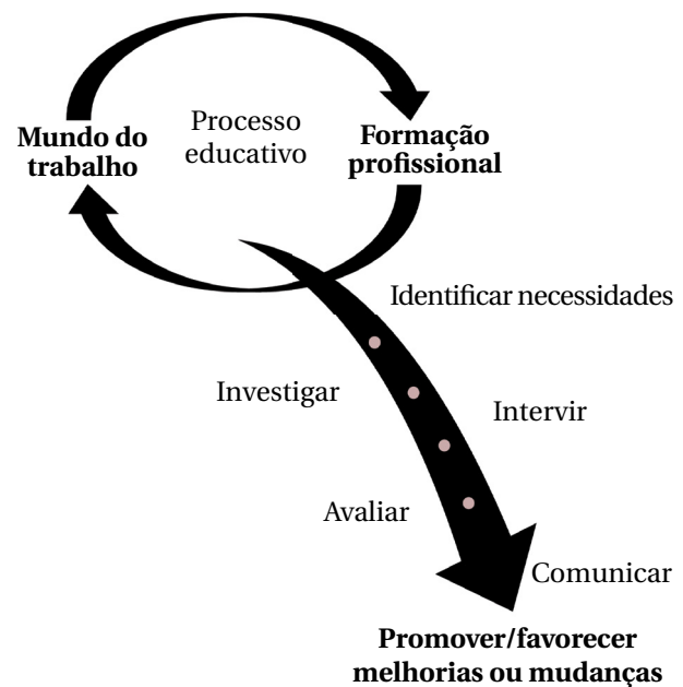
Figura 1 Competências científico-profissionais no processo de formação do psicólogo.

O exercício de uma profissão, institucionalizada social e cientificamente, requer atividade intelectual e condutas especializadas no domínio em que a profissão se estabeleceu e, de forma derivada, exige responsabilização pelos atos de quem a exerce (o que o sentido de accountability assinala, no âmbito da ética e da responsabilidade civil). Prestar serviços psicológicos na sociedade exige, por parte dos psicólogos, agir com atenção, diligência e cuidado na sua relação com os usuários, ou seja, prestar serviços legítimos e relevantes, tendo em vista as circunstâncias e os limites ético-profissionais, e de acordo com: 1) o seu título, especialidade ou expertise , resultado do processo de formação profissional básica e continuada; 2) os pressupostos oriundos do estado da arte da ciência psicológica acerca de fatos e fenômenos cuja interpretação exige o ponto de vista