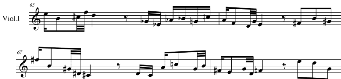
Ex. 27 – Tango derivado da série em Rimsky de Gilberto Mendes (c.65-68)