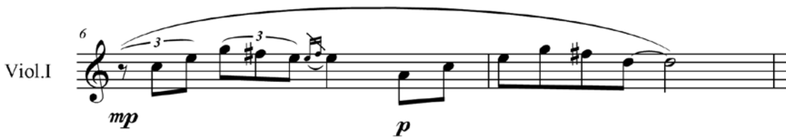
Ex.1 – Citação de Sheherazade (recitativo) em Rimsky de Gilberto Mendes (c.6-7)

Os exemplos Ex.1 a Ex.16 trazem as referências em Rimsky de Gilberto Mendes discutidas nesse artigo.