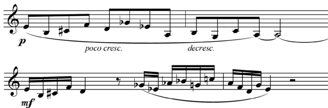
Ex.26 – Melodias derivadas da série em Rimsky de Gilberto Mendes (c.28-29 e c.61-62)