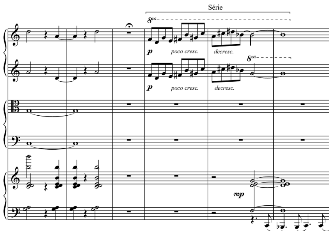
Ex.28 – Série em Rimsky de Gilberto Mendes. (c.12)

A série de Mendes é o elemento de diferença que distingue o modernismo do pós-modernismo, por desestabilizar a intenção (dodecafonica) de sons isolados e da não repetição, fazendo o percurso inverso do de Schoenberg. Ela é introduzida sempre depois de uma fermata ou de um ral-lentando , desconectada, portanto, do episódio anterior, incrementando a descontinuidade da sintaxe (Ex.28). 13