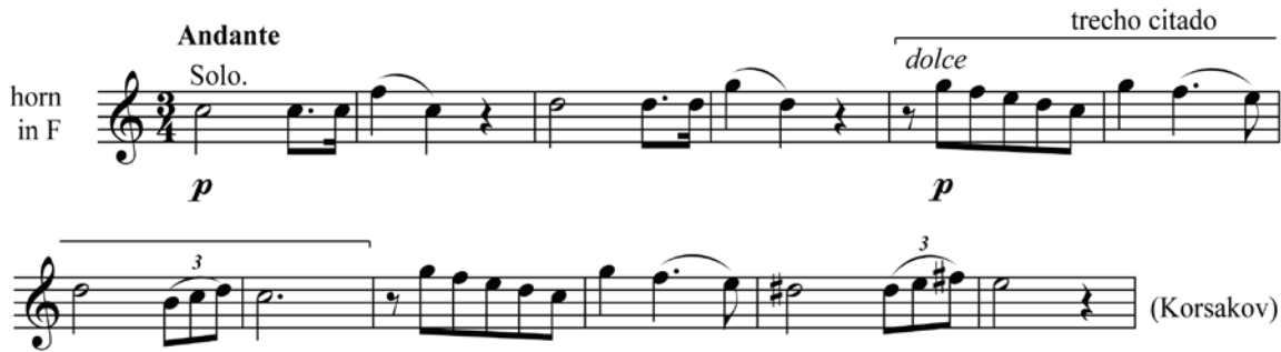
Ex.19 – Solo de trompa no II Movimento do Quinteto em Si bemol Maior para piano e sopros de Rimsky-Korsakov (c.5-8)