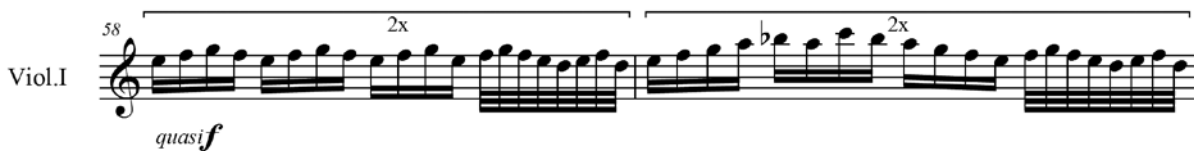
Ex.2 – Elementos inspirados em Sheherazade em Rimsky de Gilberto Mendes (c.58-59)