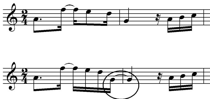
Ex.4 – Ritmo em trecho de Um a zero (c.5-6 da Seção A) na partitura e na sua realização antecipada por Benedito Lacerda (CD Pixinguinha 100 anos ).