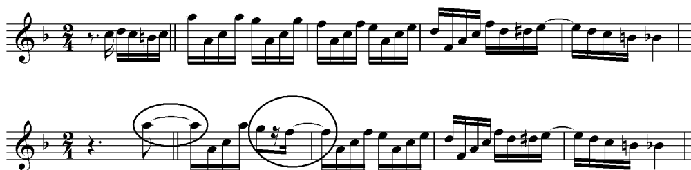
Ex.5 – Simplificação melódica e antecipações em trecho de Um a zero (c.49-51 da Seção C) na partitura e na sua realização por Benedito Lacerda (CD Pixinguinha 100 anos ).

Na gravação, observa-se claramente o "baixo condutor harmônico", descrito por ALMEIDA (1999) e SANTOS (2001), no início da repetição da Seção A (Ex.1), baixo cujos graus conjuntos e ritmo sincopado o aproximam da natureza melódica dos solos.