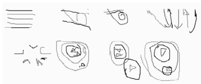
Figura 3. Episódio das Carreiras: representação com identificação das crianças.

Uma primeira experiência nesse sentido foi realizada na tese, através da elaboração de um diagrama descritivo da movimentação das crianças no episódio das Carreiras (Figura 1, neste texto). Este é um caso particularmente interessante, porque constituiu um ponto de partida para o próprio procedimento de recorte e descrição de episódios, bem como para a elaboração teórica desencadeada a partir daí: ao diagramar a movimentação das crianças, foi possível visualizar o episódio como um evento de grupo, a dinâmica de suas transformações e as pistas sobre os desencadeadores de cada novo momento recortado. Posteriormente, propusemos uma outra forma de representação desse mesmo episódio, em que a identidade das crianças foi preservada, visando aprofundar a reflexão sobre o campo interacional como um sistema de componentes mutuamente regulados (Império-Hamburger, Carvalho & Pedrosa, 2003, Figura 3).