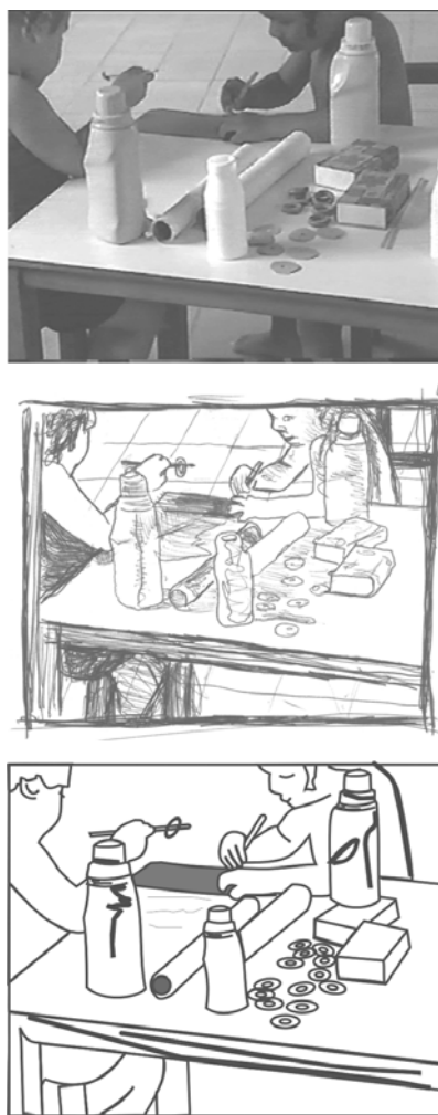
Figura 4. Foto e desenhos da mesma cena do episódio das Argolas.

Uma forma alternativa que utilizamos é fotografar, diretamente do vídeo, os momentos mais representativos ou significativos do