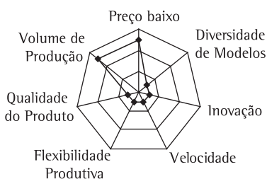
Figura 2. Importância categórica das dimensões antes do aumento da concorrência.