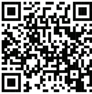
Figura 1: Código QR para vídeo sobre enterros coletivos em Manaus (TV Folha, 2020)