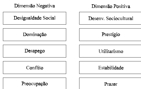
Figura 1 - Esquema fatorial hipotético organizado em níveis e dimensões

tentado nesse momento. Os fatores hipotéticos foram então comparados ao referencial da literatura, e esta comparação permitiu compreendê-los como duas dimensões opostas, positiva e negativa, organizadas em cinco níveis que atravessam desde o macrosocial até o microindividual (ver Figura 1), conforme a sugestão de Baker e Jimerson (1992).