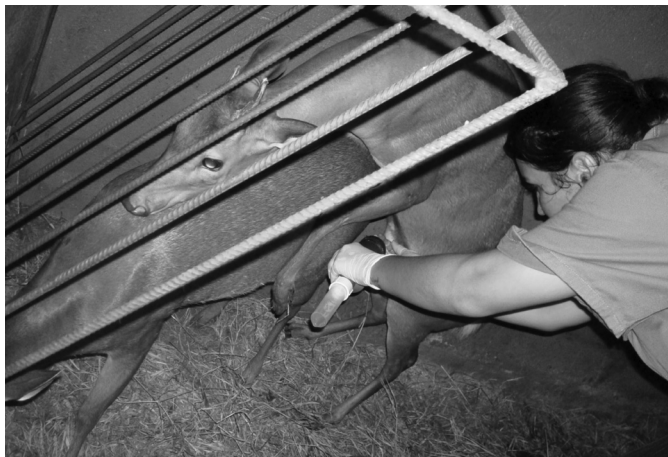
Fig.1. Macho de Mazama americana montando fêmea e operador realizando desvio lateral do pênis.

ma temperatura até a sua posterior utilização na segunda técnica (MUFE). Após a detecção do estro, realizada por pressão exercida na região pélvica (Curlewis et al. 1988), a fêmea e o macho foram colocados em baias diferentes, uma em frente à outra, e as portas foram abertas. Durante o tempo de contato entre eles foi observado o comportamento do macho quanto ao tempo de interesse e aproximação até a fêmea, reflexo de "Flehmen", ato de cheirar ou lambar, exposição do pênis, ereção, número de falsas montas, tentativa de cópula, ocorrência de agressividade entre os animais, tempo de coleta e volume de sêmen obtido. Durante a monta, o operador aproximou-se e desviou o pênis do animal lateralmente para a VA, colhendo o ejaculado (Fig.1). O tempo limite para a coleta com cada animal foi de 15 minutos, e após este período ou em caso de agressão entre os animais, estes foram separados. Durante os quatro estros sincronizados, foram realizadas tentativas de coleta (8:00-18:00 horas) com os machos e fêmeas de suas respectivas espécies, com intervalos de 30 minutos entre cada um dos machos. O número e a frequência diária de coletas foi limitado pelo tempo em que a fêmea se manteve em estro e pelo número de machos de cada espécie disponíveis para o experimento.