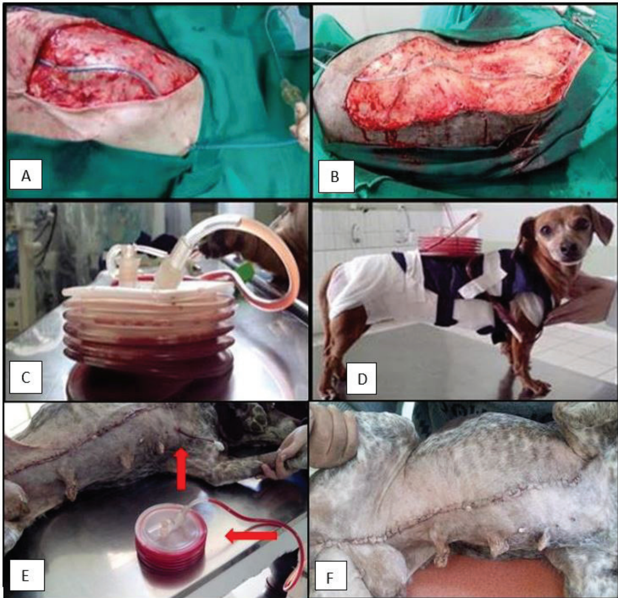
Fig.1. (A) Colocação do dreno de sucção fechado na extensão do leito cirúrgico e saída do dreno em região crânio-medial ao sítio cirúrgico, em cadela submetida à mastectomia unilateral total. (B) Fixação do dreno na pele em região crânio-medial com ponto bailarina (observa-se seta), em cadela submetida à mastectomia unilateral total. (C) Dreno de sucção fechado (cânula de 4,8mm) com reservatório pressionado para manutenção do vácuo e drenagem do líquido subcutâneo. (D) Colocação de roupa cirúrgica e suporte para acomodação do dreno, após cirurgia de mastectomia unilateral total em cadela. (E) Ferida cirúrgica de cadela após 48 horas da realização de mastectomia unilateral total pela técnica com colocação de dreno de sucção fechado (GD). Observa-se presença de exsudato em cânula e reservatório (setas). (F) Ferida cirúrgica de cadela após 14 dias da realização de mastectomia unilateral total pela técnica de colocação de dreno de sucção fechado (GD).

dois grupos foi de 72 horas, sendo que no grupo GD este coincidiu com o momento de retirada do dreno.