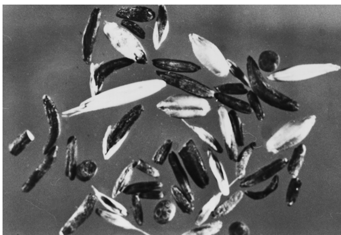
Fig. 2. Amostra da ração usada para alimentação dos bovinos em uma das três propriedades onde ocorreram os surtos de síndrome distérmica. Observam-se vários escleródios de Claviceps purpurea misturados a grãos de cereais.

Análise da ração. Nas amostras de ração dos três surtos foram encontrados escleródios de C. purpurea (Fig. 2). Esses