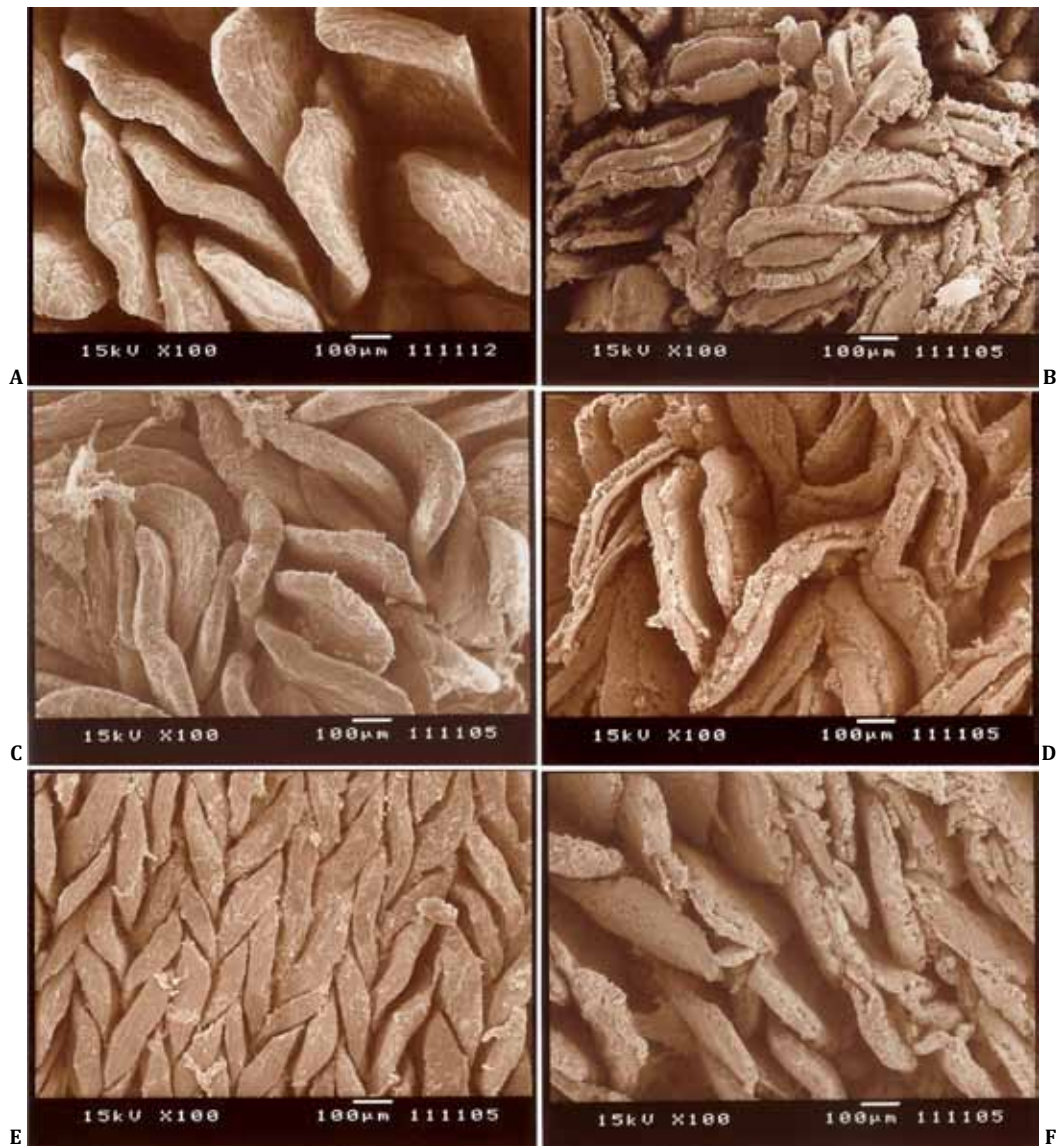
Fig.4. (A,B) Eletromicrografias do duodeno, (C,D) jejuno e (E,F) íleo de frangos de corte tratados (A,C,E) com água filtrada e (B,D,F) com água não filtrada aos 45 dias de idade. 750x.