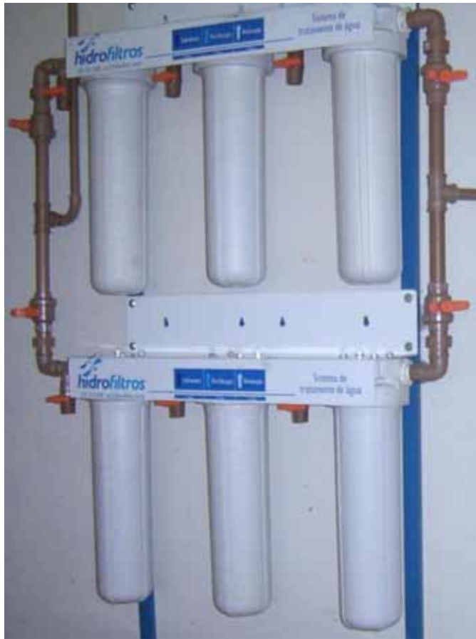
Fig.1. Filtro HF 5000 constituído por elementos filtrantes Big 5 HPC 10'' big; Big 50 PF 10'' big, Hidrofiltros®, utilizado durante o experimento.

As condições microbiológicas da água de dessedentação foram avaliadas do período inicial de vida das aves até a saída do lote para abate, com colheitas realizadas em intervalos de sete dias em um total de sete colheitas. Foram pipetados 0,5mL de tiosulfato de sódio em frascos de vidro com capacidade de 250mL para a amostragem da água não filtrada, enquanto os frascos para a colheita da água do filtro não apresentavam tiosulfato de sódio, por não conter cloro. Os frascos estéreis foram utilizados para a colheita de 200mL de amostra de cada tratamento, diretamente do bico do bebedouro nipple , por meio de espátula de madeira estéril (Fig.3). As amostras foram transportadas sob refrigeração para o