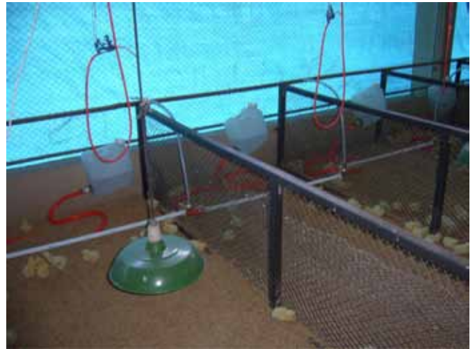
Fig.2. Galpão com nipple de três pontos de abertura de água para cada boxe, cama de maravalha e lâmpadas.