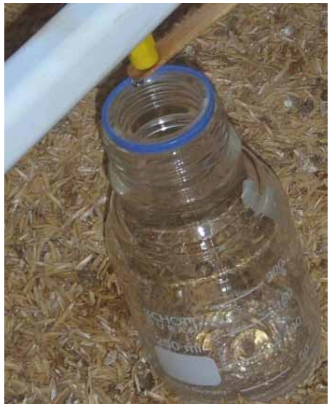
Fig.3. Colheita semanal de amostras de água no bico de bebedouros tipo nipple utilizando espátula de madeira estéril.

laboratório de Medicina Veterinária Preventiva, sendo realizadas análises bacteriológicas logo após a chegada das mesmas. Para a determinação de coliformes totais e Escherichia coli , utilizou-se o ensaio cromogênico empregando o Kit Colilert. Os resultados foram expressos em NMP/100 mL consultando a tabela de NMP fornecida pelo fabricante, em que são dados os limites de confiança de 95% para cada valor de NMP determinado.