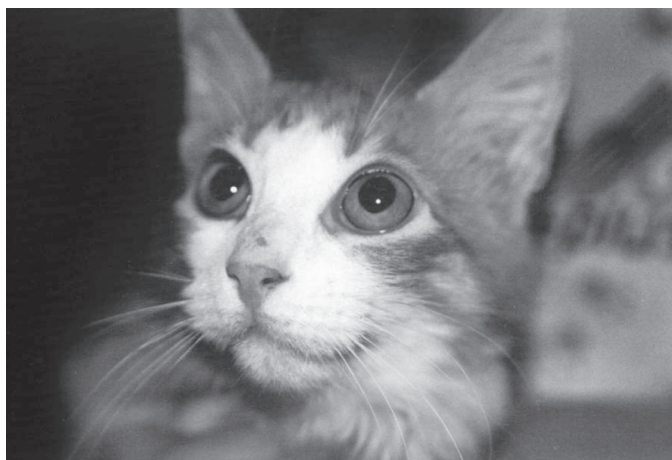
Fig.3. Mesmo felino da figura anterior, 20 dias após a última administração do lufenuron. Crescimento dos pelos em face e orelhas, com exceção de área puntiforme de cicatrização.

nucleadas; observou-se também que a intensidade da infecção era inversamente proporcional à resposta inflamatória.