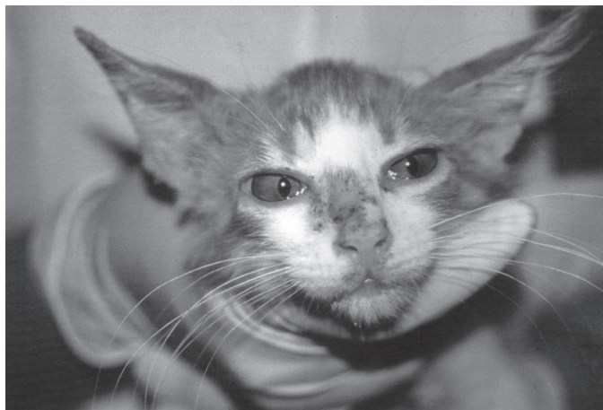
Fig.2. Felino antes de iniciar o tratamento. Áreas múltiplas de hipotricose, crostas e hiperemia na face e orelhas.