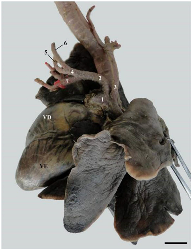
Fig. 2. Arco aórtico de Cerdocyon thous ex situ onde podemos observar o arco aórtico (1), tronco braquiocefálico (2), artéria subclávia esquerda (3), tronco bicarotídeo (4), artéria carótida comum direita (5), artéria carótida comum esquerda (6), artéria subclávia direita (7), o ventrículo direito (VD) e o ventrículo esquerdo (VE). Barra de escala: 2cm.

A artéria subclávia direita originou o tronco costocervical direito, a artéria vertebral direita, a artéria torácica interna direita e a artéria cervical superficial direita. Após a emissão desses ramos, ao alcançar o espaço axilar, passa a ser denominada de artéria axilar direita possuindo um maior calibre em relação aos seus ramos, podendo ser considerada como continuação da artéria subclávia direita (Fig. 1).