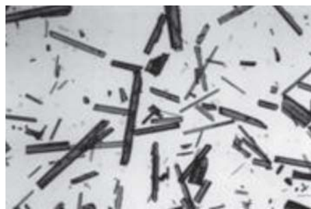
Figura 1. Microscopia óptica dos cristais de \beta -lapachona na objetiva 4x

Os cristais observados no microscópio óptico para análise granulométrica tinham um tamanho praticamente uniforme, originando um tamanho médio de 233,1 \mu\text{m} como observado na Figura 2.