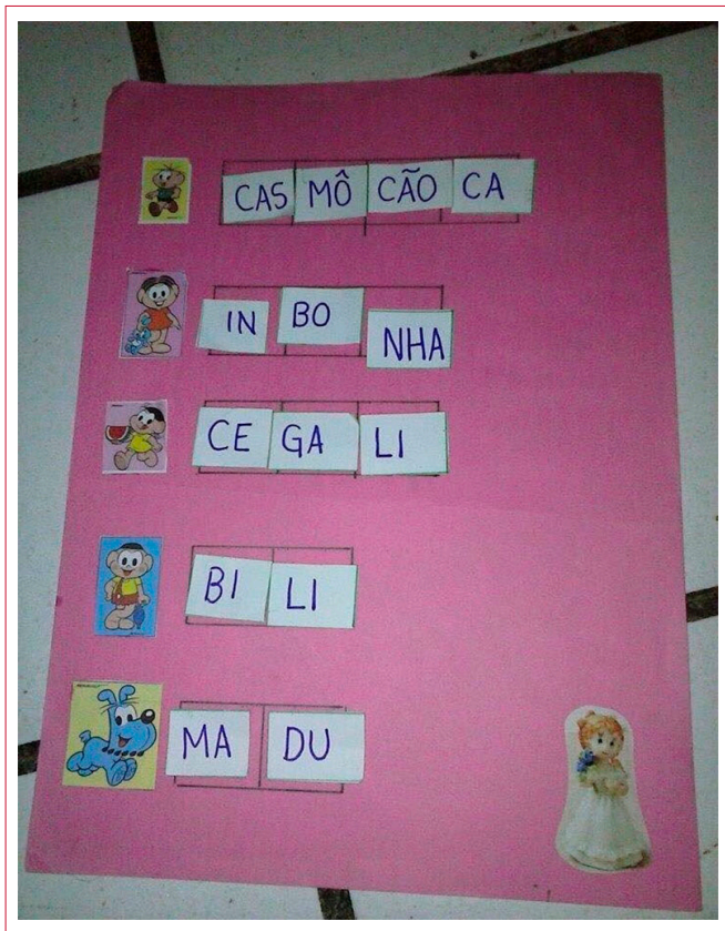
Figura 2. O meme "Inbonha"

personagem mais icônico, por exemplo, é chamado de “Inbonha” na figura 2.