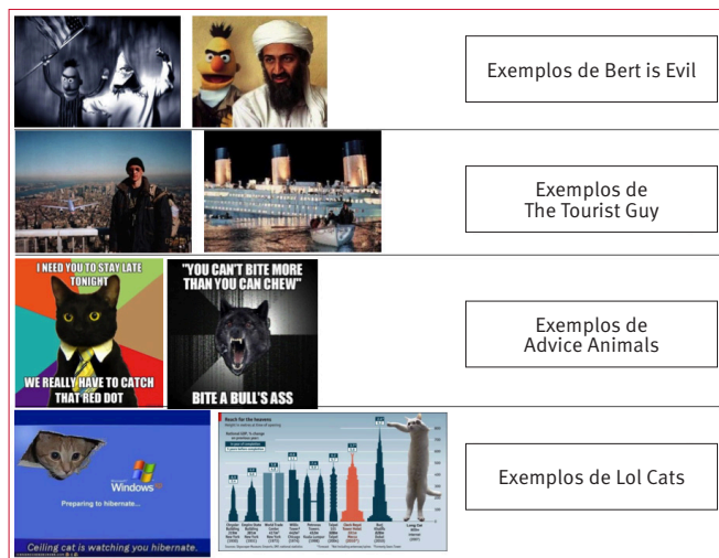
Figura 1. Exemplos de memes da internet