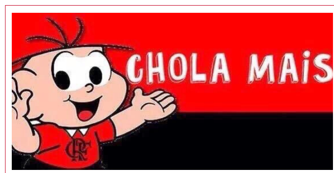
Figura 5. O meme Chola Mais aplicado no contexto do futebol