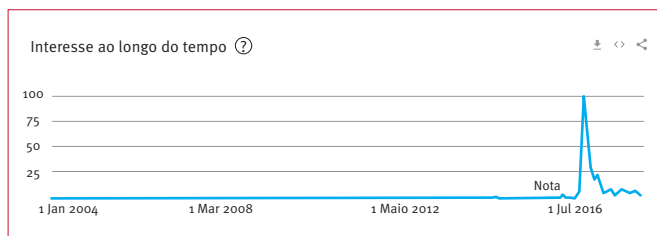
Gráfico 1. Pesquisa de tendências para o termo "Inbonha"

Nota: O gráfico indica o pico de popularidade (100) e a proporção de pesquisas.