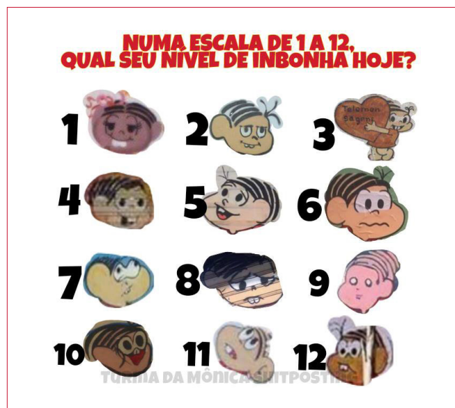
Figura 3. Exemplo de intertextualidade