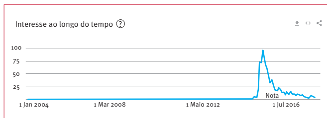
Gráfico 2. Tendências para a pesquisa do termo "Chola Mais"

Nota: O gráfico indica o pico de popularidade (100) e a proporção de pesquisas.