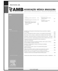
Imagem em Medicina