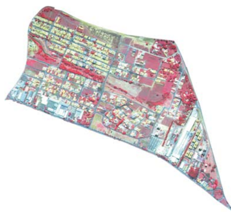
Figura 2 – Videografia do bairro Santa Cecília, Piracicaba, Estado de São Paulo, em 2003.

Figure 1 – Aerial photographs of the Santa Cecília neighborhood, Piracicaba, State of São Paulo,