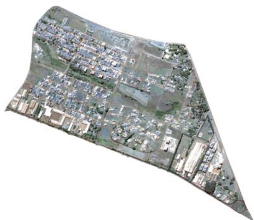
Figura 1 – Fotografia aérea do Bairro Santa Cecília, Piracicaba, Estado de São Paulo, em 2001.

Figure 1 – Aerial photographs of the Santa Cecília neighborhood, Piracicaba, State of São Paulo,