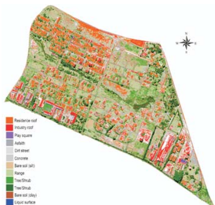
Figura 3 – Modelo digital por fotografia aérea do Bairro Santa Cecília, Piracicaba, Estado de São Paulo, em 2001. Figure 3 – The digital model by aerial photography of the Santa Cecília neighborhood, Piracicaba, State of São Paulo, Brazil, in 2001.