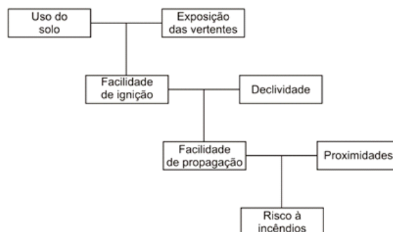
Figura 1 – Árvore de decisão de riscos a incêndios. Figure 1 – Decision tree of fire risk.

Os cartogramas produzidos para geração do mapa final são mostrados na Figura 2.