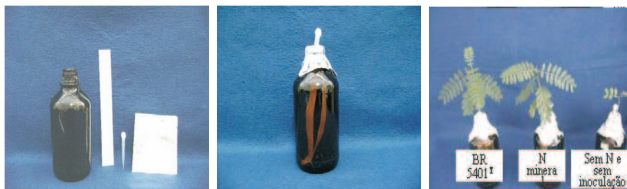
Figura 1 – Materiais utilizados para o preparo dos frascos contendo solução nutritiva de Jensen (1942) sem nitrogênio onde Sesbania virgata foi cultivada (A); Frasco sem a planta (B); Frascos contendo S. virgata inoculada com a estirpe BR 5401 T , com N mineral (35 \text{mg kg}^{-1} ) e sem N e sem inoculação (C).

Figure 1 – Materials used for the preparation of flasks containing Jensen nutritive solution (1942) without nitrogen where Sesbania virgata was grown (A); Flask without the plant (B); Flasks containing the control treatments in S. virgata : inoculation with the strains BR 5401 T , without inoculation, with mineral N (35 \text{mg kg}^{-1} ) and without mineral N (C).