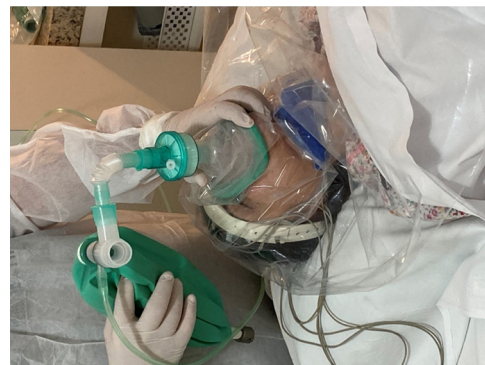
Figura 1 Técnica para redução do risco de contaminação por COVID-19 durante o procedimento de ECT.

Acreditamos que seja uma forma segura e efetiva de reduzir o risco de contaminação pelo COVID-19 durante o procedimento de ECT.