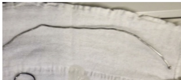
Figura 1 Fio guia metálico usado.

Paciente masculino de 12 anos, 35 kg, encaminhado ao CC pela urgência para apendicectomia aberta. Chegou à S.O. acompanhado pela mãe, a qual negou alergias, comorbidades ou uso regular de medicamentos. ASA I, FC 110 bpm; PA 108×52; Sp O 2 : 96% ar ambiente; BEG, normocorado, desidratação leve, eupneico, lúcido e orientado. Quanto às