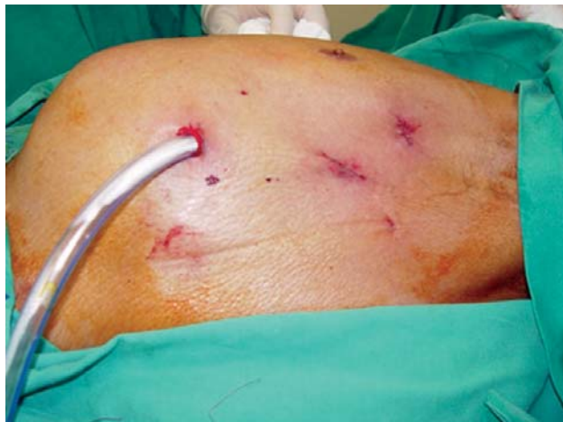
Fig. 4 - Aspecto final do procedimento. Dreno torácico posicionado através do orifício mais inferior