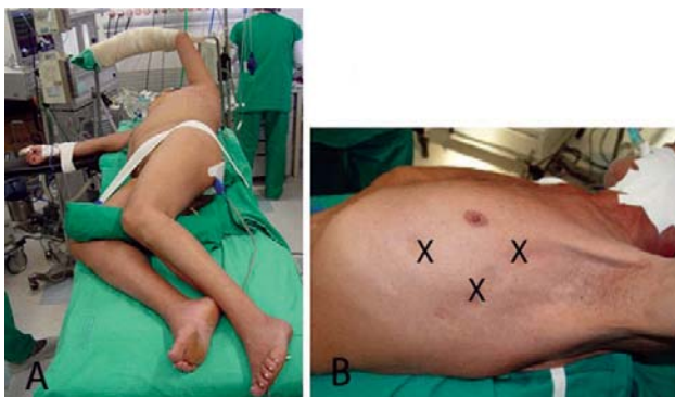
Fig. 1 - A: Posicionamento do doente em decúbito lateral. B: Posição dos trocateres

Três trocateres (Thoracoport - Ethicon - Estados Unidos) foram posicionados para a introdução da ótica (Olympus - Japão; 10mm; 30°) e dos instrumentos endoscópicos (Ethicon Endosurgery - Estados Unidos; tesoura curva, pinça de preensão, pinça de dissecação e aspirador), um de 10 mm e dois de 5 mm, localizados, respectivamente, no quinto, quarto e sexto espaços intercostais nas linhas axilares médias (10 mm) e anteriores (5 mm) (Figura 1).