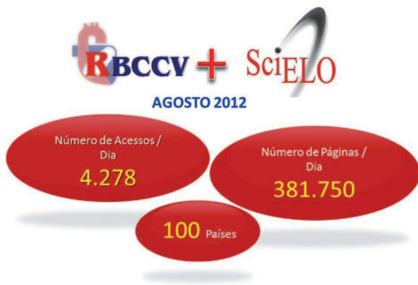
Fig. 2 - Acessos aos sites da RBCCV/BJCVS em agosto de 2012

aqueles cujo conteúdo não segue os padrões mínimos exigidos pelo Corpo Editorial. Nosso índice de rejeição está na casa dos 40%, muito superior ao que era até alguns anos atrás. Por outro lado, os 60% que vão para o processo de revisão e posterior publicação têm tido um nível cada vez maior, demonstrando a preocupação dos autores em desenvolver trabalhos bem embasados, pautados pelos mais rígidos princípios científicos e éticos.