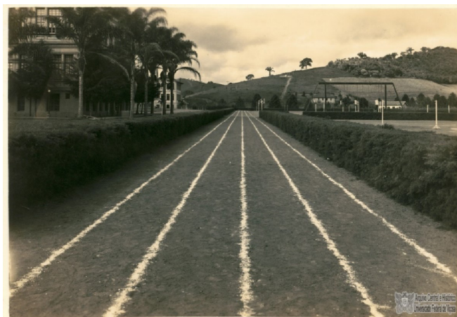
Figura 1. Praça de esportes. Vista parcial da praça de esportes, [s/d].

Percebemos que os investimentos nas práticas corporais para a formação dos esavianos foram defendidos em reportagens que circulavam na revista. Os esportes eram vistos como preponderantes aos futuros profissionais formados pela Escola, devido aos benefícios higiênicos da prática. Justificou-se que “o estudante de agricultura necessita da prática dos esportes, por que resistirá as intempéries dos campos ou o abafamento do gabinete, o indivíduo fisicamente robusto.” (Athayde, 1944, p. 35).