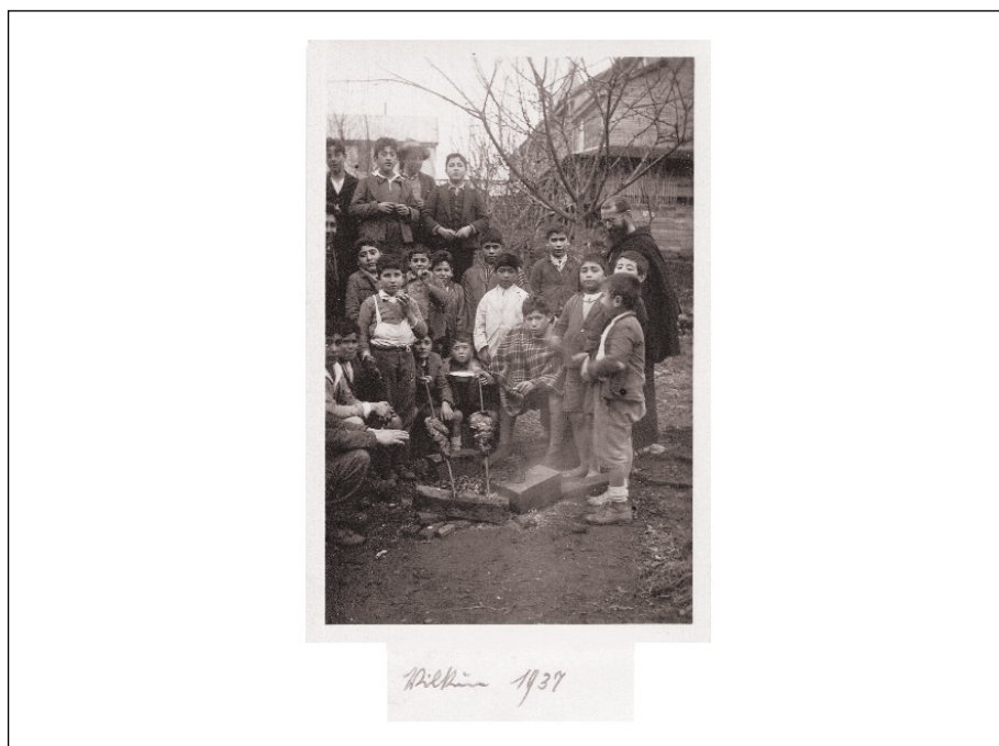
Figura 5 – Schulbuben des Internats von Vilcún, 1927. Niños escolares del internado de Vilcún, 1927.