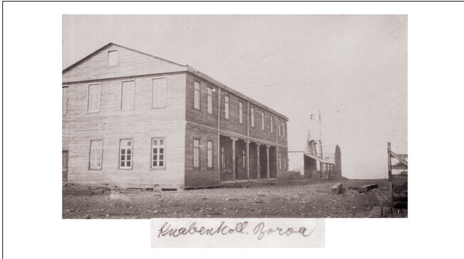
Figura 2 – Anverso fotografía. Colegio de Niños.

de las alumnas internas desde principios del siglo XX estuvo a cargo de diversas congregaciones religiosas femeninas, principalmente las religiosas de la Santa Cruz, religiosas Franciscanas y religiosas de la Providencia. Uno de los aspectos más interesantes de la formación que identificó las prácticas formativas es el control de todos los aspectos del mundo de la vida cotidiana de las alumnas internas: desde