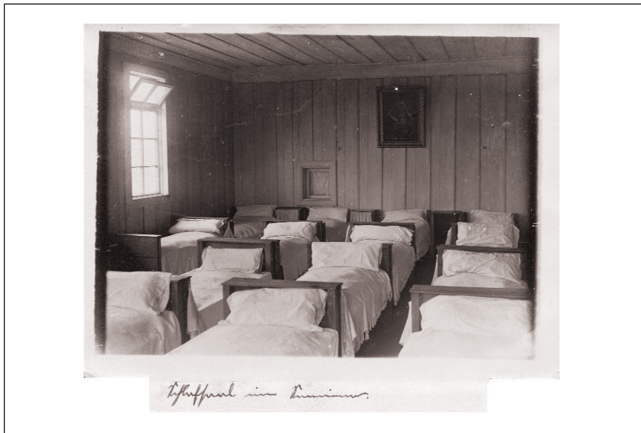
Figura 7 – Schlafsaal im Indianerkolleg Internats”. Dormitorio en el colegio internado de indios, 1910, Bajo Imperial.

Las alumnas podían ser visitadas por sus padres o apoderados todos los domingos y días festivos de 11 Am y 4 PM, exceptuando el tiempo reservado para el almuerzo, 11.45 a 12.30). Sin causa especial no era permitido realizar visitas extraordinarias. A las alumnas internas se les concedía salir el primer domingo de cada mes, siempre y cuando sean los padres quienes las retiren. Se excluía del permiso de salida “a aquellas alumnas a las que se les haya observado mala conducta, o hubieran sido desaplicadas en sus estudios. En septiembre tenían derecho a un asueto de diez días” (Archivo Obispado de Villarrica, 1926, p. 11-12).