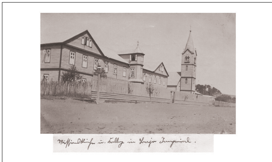
Figura 4 – Kolleg von Panguipulli. Colegio misión-internado, Panguipulli, 1907.