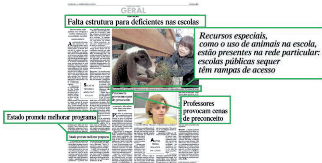
Figura 7. Análise de layout da página