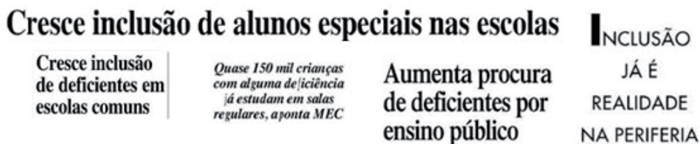
Figura 1. Títulos sobre a expansão de matrículas no ensino regular

No âmbito legal e político, o acesso de alunos público-alvo da Educação Especial à classe comum de escolas do ensino regular, traduzido no aumento do número de matrículas, consiste em um indicador importante, embora isso não signifique que o direito à educação esteja sendo garantido. No jornal, entretanto, a expansão do número de matrículas dos alunos público-alvo da Educação Especial ganhou espaço, e foi traduzida como “inclusão”, sendo a visibilidade desse tema percebida logo no título das matérias, conforme mostra a Figura 1.