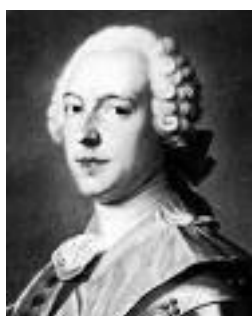
Figura 1 - Retrato de Cagniard de la Tour.

O barão Charles Cagniard de la Tour (1777-1859), mostrado na Fig. 1 e morto há 150 anos, foi o descobridor dos fenômenos críticos. O que se iniciara como uma curiosidade exótica tornou-se uma área que hoje vive sua plena maturidade, formando um dos pilares da física de sistemas complexos e muitos corpos. Descrevemos aqui as circunstâncias deste descobrimento e a evolução da área até os dias atuais.