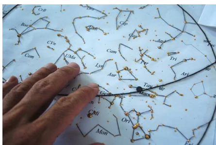
Figura 2 - Detalhes de um dos mapas utilizados na primeira sessão de avaliação. As estrelas foram feitas com tinta-relevo; o horizonte e a linha da eclíptica com barbante para artesanato; o planeta Marte é um pequeno círculo de EVA e os desenhos das constelações foram costurados ao mapa com linha comum.

Cada situação é demonstrada por dois mapas que idealmente devem ser manuseados lado-a-lado: um apenas com o horizonte, as estrelas e os planetas (e a Lua, se for o caso) e o segundo para o mesmo local e horário mas com os desenhos das constelações e a linha imaginária da eclíptica. A situação é diferente para a demonstração dos efeitos da poluição luminosa. Neste caso um dos mapas possui o horizonte e as estrelas aplicadas em tinta-relevo até o limite que pode ser observado pelo olho humano (magnitude menor do que 6) em uma idealizada e despoluída São Paulo e o segundo mapa é feito apenas com as estrelas mais brilhantes (magnitude menor do que 2,5, aproximadamente), que realmente podem ser observadas em noites sem nuvens. Estes mapas são mostrados na Fig. 3.