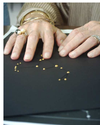
Figura 8 - Avaliação das figuras das constelações mostradas ampliadas e de forma independente dos mapas celestes. O material foi criado seguindo sugestões do grupo de avaliação durante o primeiro encontro e demonstrado na segunda ocasião.

O grupo de avaliação foi constituído por nove pessoas, incluindo voluntários que estiveram presentes no primeiro encontro, além de alguns profissionais da área da saúde da Fundação. Em particular, foi convidado um portador de baixa visão para tentar analisar se o contraste nos mapas com fundo escuro favorecia a utilização do material, buscando assim a resposta à questão levantada na primeira reunião. Os principais resultados da avaliação são listados a seguir.