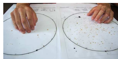
Figura 3 - Mapas demonstrando o efeito da poluição luminosa em São Paulo durante sessão de avaliação do material.

O efeito da poluição luminosa é surpreendente - O grupo ficou surpreso ao verificar como a atuação do homem no meio ambiente cada vez mais cria obstáculos para a observação do céu noturno. Como era desejado, isso levou à discussão sobre o que era a poluição luminosa e o como poderia ser evitada ou amenizada, dentro de um contexto de consciência e preservação ambiental;