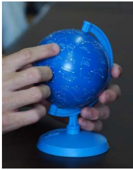
Figura 4 - Esfera celeste de 10 cm de diâmetro com aplicações em relevo, durante reunião de avaliação na Fundação Dorina Nowill.