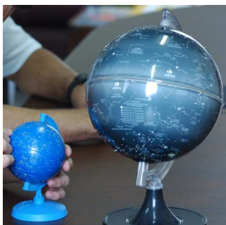
Figura 6 - A esfera celeste de 21 cm de diâmetro, comparada com a de 10 cm, feita segundo as recomendações do grupo e avaliada na segunda reunião.