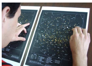
Figura 7 - Protótipos dos mapas celestes com fundo escuro, buscando avaliar a melhor alternativa para portadores de baixa visão.