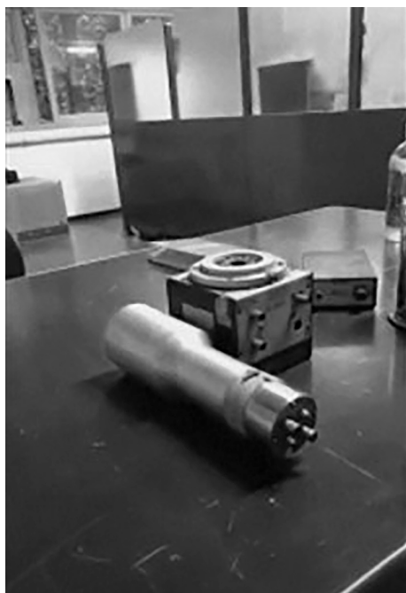
Figura 6: Partes do cintilômetro utilizados por Roser e o grupo de cientistas da PUC nos anos 1960, depositadas no Laboratório Francisco Xavier Roser (Acelerador eletrostático) PUC-RJ. Ao centro um capsula de NaI(Tl). Fotografia tirada por Marcos Martinho, em 12/08/2021.

poderia blindar total ou parcialmente as radiações, ou em alguns casos até emitir, caso tivessem sido utilizados materiais locais como areia da praia. As residências eram classificadas de acordo com o material usado em suas edificações: estuque, tijolo e concreto.