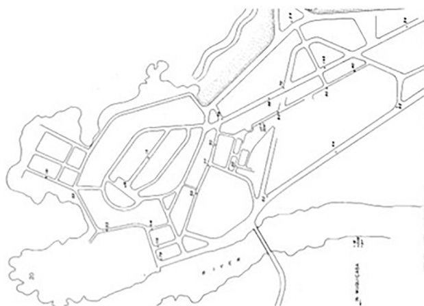
Figura 4: Mapa do centro da cidade de Guarapari (1960) com as estações de medidas de radiação de fundo obtidos por meio de detectores de radiação.

lá fazendo um levantamento não só da praia, mas da cidade toda. E foi um trabalho! 45