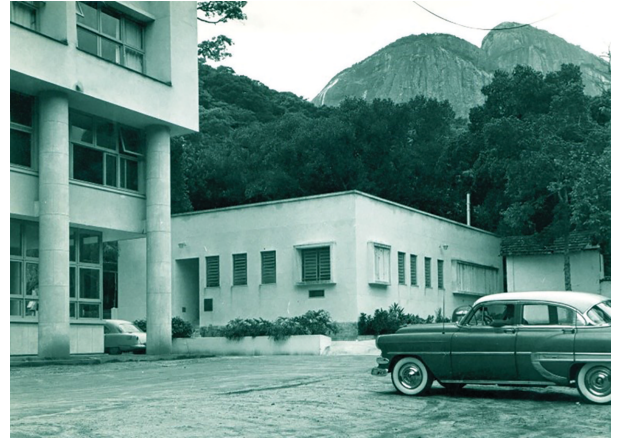
Figura 8: Laboratório de Dosimetria da PUC-RJ, Campus Gávea, construído com apoio da CNEN. Local onde foi instalado o Contador de Corpo Inteiro, provavelmente fins da década de 1950).