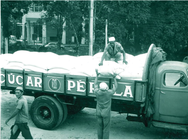
Figura 7: Caminhão com 10 toneladas de açúcar doadas pelo Instituto do Álcool para serem usados como blindagem no Contador de Corpo Inteiro, instalado no Laboratório de Dosimetria da PUC-RJ, Campus Gávea (provavelmente fins da década de 1950).

media diretamente o conteúdo corporal, independe de métodos indiretos. 64