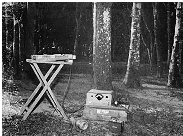
Figura 5: Câmara de ionização sobre a mesa, a 1 m do chão, o eletrômetro sobre outros equipamentos, utilizados por Roser nos levantamentos radiométricos realizados no Projeto Guarapari. O local da foto não é informado, mas inferimos que seja no Campus da Gávea da PUC-Rio, pois a foto é indicada como equipamento de campo.

A câmara de ionização tinha forma quadrada e operava em conjunto com um vibrating reed electrometer, equipamento, projetado por Hess e colaboradores da Universidade de Fordham, que media radiações gama do