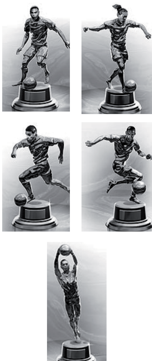
FIGURA 6 - Imagens de Ronaldo, Ronaldinho Gaúcho, Adriano, Robinho e Dida.

“A Copa do Mundo tem o poder de transformar homens em mitos. Escolheram os cinco brasileiros com maior chance de chegar lá” (PADILHA, 2006, p.45), referindo-se aos jogadores que aparecem na FIGURA 6; respectivamente Ronaldo “Fenômeno”, Ronaldinho Gaúcho, Adriano, Robinho e Dida. A imagem de tais atletas é simbolizada como miniaturas de taça do Mundo, ou seja, em movimentos plásticos de rara beleza congelados, em ouro, os possíveis heróis brasileiros seriam eternizados. “Entram em campo 22 jogadores. O herói da jornada pode ser o artilheiro que faz o gol decisivo. Mas também o goleiro que defende o pênalti” (PADILHA, 2006, p.44), justificando assim, a possibilidade da mitificação do Dida em um cenário que consagra mais facilmente por atletas de linha. O esporte passa, então, a condição de arte: “Duas particularidades tornam o futebol ainda mais dramático que a mais dramática das peças. Ninguém sabe o final de antemão. E, mais que isso, ninguém sabe quem será o protagonista” (PADILHA, 2006, p.44).