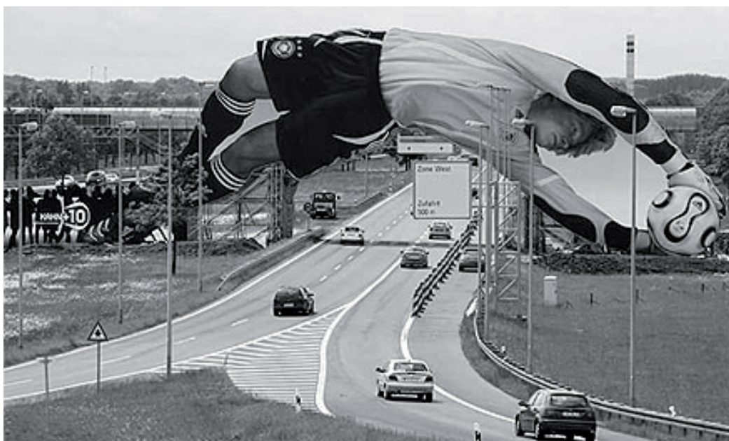
FIGURA 7 - Anúncio publicitário da Adidas.