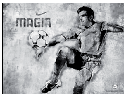
FIGURA 4 - Imagens de Roberto Carlos, Edgar Davids, Thierry Henry, Ronaldo e Figo.

Fonte: Campanha publicitária Nike – Footballx