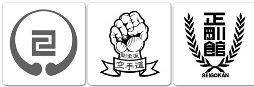
IOGKF (Okinawa Gōjū-ryū)