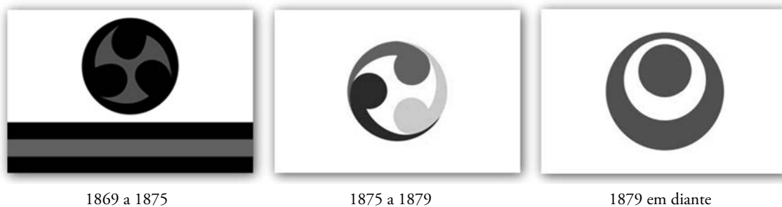
FIGURA 5 - Símbolos das escolas de Shōtōkan-ryū .