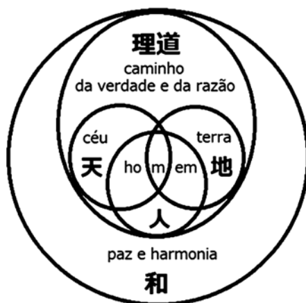
FIGURA 8 - Representação gráfica da filosofia da poesia de Otsuka.