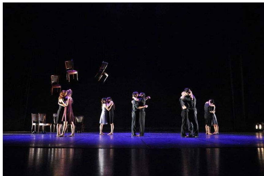
Figura 8 – Final de la obra.

Por otra parte, quisiéramos destacar la dimensión íntima y de afecto que culmina la obra. Frente a la narrativa de los huesos, del documento/monumento, la carne/la performance/el repertorio toma preponderancia, primero remontando los fragmentos de la obra misma y luego mediante la aparición del carácter del afecto. Emerge la sensibilidad del sujeto por sobre la memoria de la cultura del archivo, se hace presente en contraposición escénica a la ausencia espectral representada por las sillas, que, de todos modos, asedia a los cuerpos presentes (Figura 8).