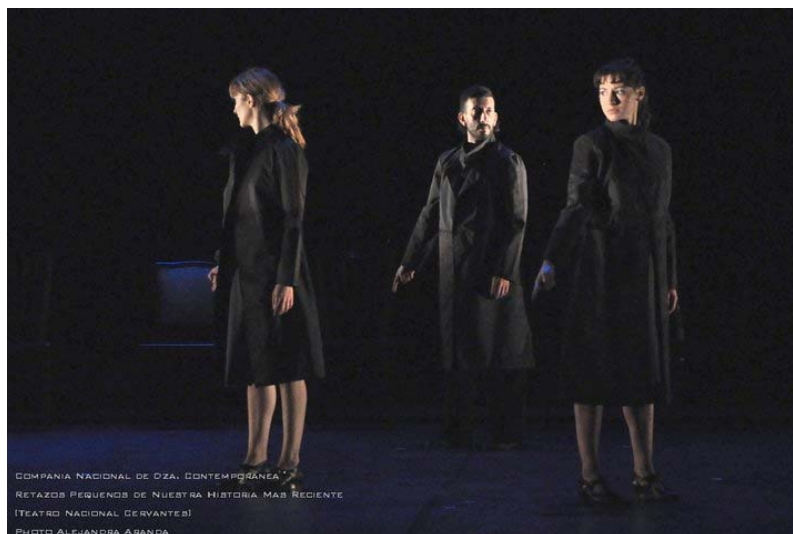
Figura 2 – Gesto de señalamiento.

Tras terminar su discurso, el personaje se quita los lentes y pasa a formar parte del grupo, que vuelve a ingresar a escena. Ahora todos están vestidos con un sobretodo negro y el cabello atado, uniformados. Comienzan una coreografía de movimientos entrecortados, espasmódicos, casi robóticos , con una música que marca velocidad y frenesí. El gesto que quisiéramos destacar de este momento es el de señalamiento (Figura 2), como parte del repertorio de la dictadura. Los bailarines frecuentemente realizan el gesto de señalar con el dedo, corporizando de ese modo la memoria de los cuerpos bajo vigilancia continua durante la dictadura, así como el ejercicio de la delación por parte de los ciudadanos. La memoria de los cuerpos normalizados es representada aquí por medio del cambio de vestimenta y de los movimientos rígidos y mecánicos, que se repiten hasta que todos devienen marionetas , como puede observarse en la pose final de esta coreografía: con los brazos en alto y las muñecas colgando, como si tuvieran hilos desde los que se suspenden, los bailarines van plegando su torso hacia sus piernas (Figura 3).