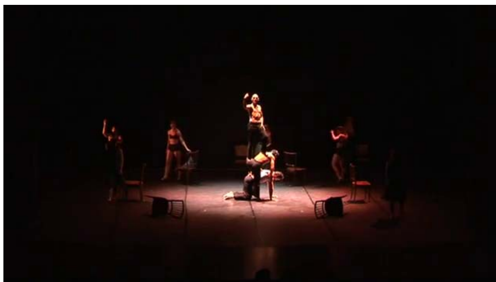
Figura 5 – Las mujeres caminan alrededor de la estatua en formación.

Posteriormente, inicia la música y, con ésta, un trío de hombres en el centro del círculo, que ejecutan una danza caracterizada por movimientos ondulantes, el trabajo de partenaire y el afecto e intimidad demostrado en esos gestos de apoyo, entrega del peso y el compartir del eje. Los demás los observan; las mujeres, desde las sillas a su alrededor. Ellos comienzan a formar una figura central, apoyándose en sus cuerpos como base. Uno de los bailarines se coloca de pie y alza su puño en alto, como una imagen estatuaria. Mientras tanto, las bailarinas han comenzado a caminar en círculo alrededor de ellos, mientras se quitan sus vestidos, quedando en ropa interior (Figura 5). Aquí, el gesto puede remitir a las Madres de Plaza de Mayo girando alrededor del monumento a la Pirámide de Mayo, como modo de manifestarse reclamando por la aparición de sus hijos. Sin embargo, esta Patria (la Pirámide de Mayo) no es mujer ni tiene otras armas a no ser su puño en alto (signo de lucha). Y estas madres sólo mantienen el gesto simbólico del caminar. Nuevamente, se corre aquí el lugar común de la memoria oficial de los hechos, ya que el monumento (tanto el estatuario como las Madres en sí) no es representado miméticamente, sino que puede inferirse del gesto de la caminata alrededor, es decir, a partir del cuerpo y movimiento, de su coreografía; sin embargo, su connotación de lucha está representada a partir de otro gesto históricamente reconocible (el puño en alto).