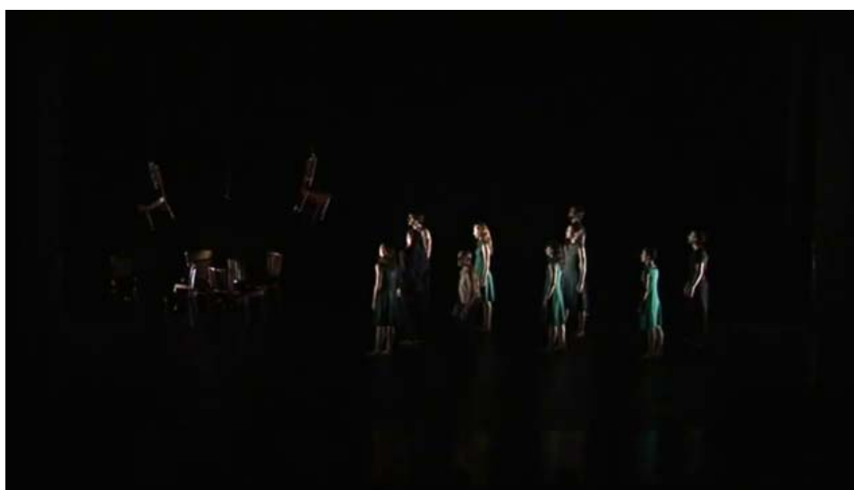
Figura 7 – Contraposición presencia/ausencia.

La luz va bajando poco a poco, ellos continúan su coreografía de la memoria de la obra, mientras las sillas se encuentran agrupadas, desordenadamente , a un costado del escenario y dos de ellas comienzan a elevarse. Los bailarines también rompen con la estructura de dúos y se mezclan, se colocan de pie, en el costado opuesto a las sillas y las miran (Figura 7). Continúan su danza, que repone otros fragmentos del repertorio propio de la obra, tales como los movimientos de marionetas. Caminan entre ellos, tocándose suavemente con las manos, incluyendo también a las sillas a partir de la mirada, hasta reagruparse nuevamente en parejas diversas (hombre y mujer, mujer y mujer y hombre y hombre) y finalmente besarse y abrazarse hasta que invade el escenario la luz azul y cae el telón.