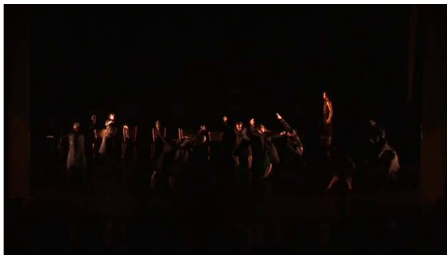
Figura 3 – Cuerpos normalizados devienen marionetas.

Elegimos hablar de estos cuerpos como “normalizados” por dos motivos. Por un lado, durante la dictadura del ‘76 – así como en otros regímenes autoritarios –, frecuentemente se intervenían las instituciones con el fin de realizar un proceso de normalización 7 . Además, por otro lado, podemos tomar el término en el sentido foucaultiano según el cual la norma está ligada a la disciplina y a la biopolítica, es decir, al biopoder – como poder sobre la vida y la muerte –, el poder que tiene como objetivo los individuos, el poder que se ejerce sobre las poblaciones. Se distingue entre lo normal y la patología y se impone un sistema de normalización de los comportamientos, de los afectos, del trabajo, de la sexualidad, de la salud, etcétera. Es la estatuación de la vida biológicamente considerada, es decir, del hombre como ser viviente, y la normalización es el proceso de regulación de la vida de los individuos y de las poblaciones (Castro, 2004).