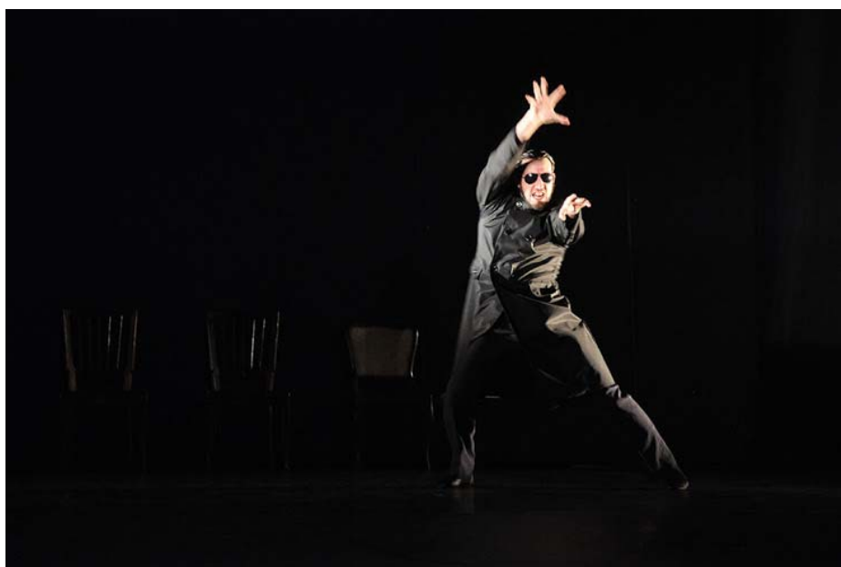
Figura 1 – El personaje que representa el autoritarismo da su discurso danzado.

con determinación y rigidez, emulando dar un discurso (Figura 1). En lo sonoro, lo acompaña efectivamente un discurso que suena como si fuera en alemán, aunque no lo es. En realidad, son las palabras del Comunicado trastocadas por un montaje sonoro. Aunque las palabras conservan su orden en la oración, las letras que componen cada palabra, no, buscándose así el efecto resultante de parecido con respecto al idioma alemán (Fortuna, 2012). Eso genera una comparación entre la dictadura argentina y el régimen nazi. Sin embargo, tal como lo expone Fortuna, a la vez que fomenta comparaciones entre autoritarismos, también enfatiza que uno no es reductible al otro. “Se pone en duda aquello que suena disciplinante, a la vez que la desorganización de las palabras disminuye su autoridad disciplinaria performativa” 6 (Fortuna, 2012).