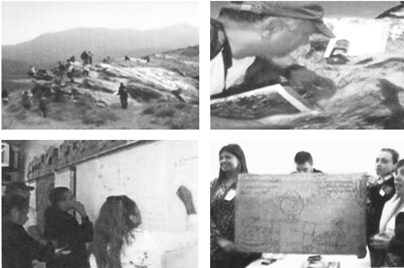
Figura 1 – Mapeamento Socioambiental com Professores e Comunidade