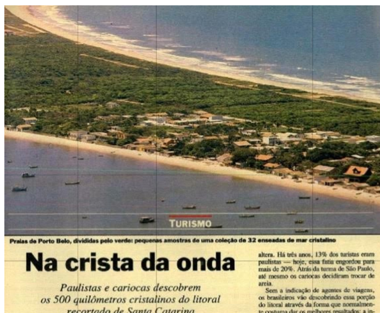
Figura 2. Mat ria publicada na revista Veja

As fotografias come avam a desempenhar um papel importante na configura o dessa “geografia praiana privilegiada”, como a revista Veja definia o litoral catarinense (Figura 2), j  frequentado “pelos argentinos” e “descoberto pelos cariocas e paulistas” (NA CRISTA, 1990, p. 56). As fotografias iam compondo as narrativas midi ticas, tornando-se fortemente respons veis por “comprovar” que essa paisagem, de t o ensolarada e praiana, s  poderia ser tur stica.