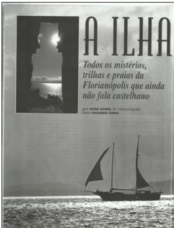
Figura 3. Matéria publicada na revista Os Caminhos da Terra