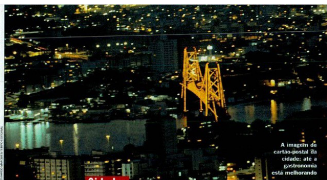
A imagem de cartão-postal da cidade: até a gastronomia está melhorando