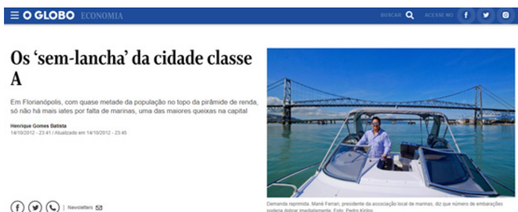
Figura 4. Matéria publicada no jornal O Globo

Nesse período, a linguagem imagética servia para referendar que essa cidade seria o que as imagens proferiam. Por conta das facilidades tecnológicas, as imagens tornaram-se mais “vivas”, coloridas e maiores, recebendo destaque nas páginas e remetendo o leitor aos lugares e sensações retratados, como mostra a Figura 4. A interlocução de fotografias e textos pretendia fazer com que as pessoas se projetassem aos lugares das narrativas. A construção da visibilidade dessa cidade turística, portanto, não se fazia somente por meio de seus atributos visuais, mas também levava em conta o imaginário e as concepções de lugares turísticos em voga em cada época. Como expõe Cosgrove (2008), aquilo que é visível é determinado pelo contexto cultural, visto que a própria visão não é uma faculdade livre de seu contexto. Os textos da publicidade turística começavam a remeter-se ao discurso técnico do planejamento urbano, buscando atrelar uma cidade para turistas de alto poder aquisitivo à necessidade de implementação de planos para controlar o crescimento desordenado da prática turística, bem como às preocupações de fundo ambiental. O planejamento urbano reaparecia como um argumento que, de forma oficial e apoiado na legislação, serviria para legitimar o controle social e o crescimento orientado do turismo e do público na cidade.