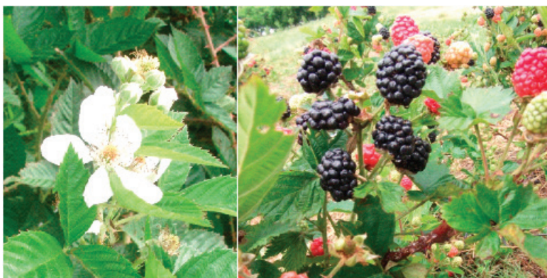
FIGURA 2- Amoreira-preta cultivar Tupy, floração e frutificação na região de Pelotas-RS.