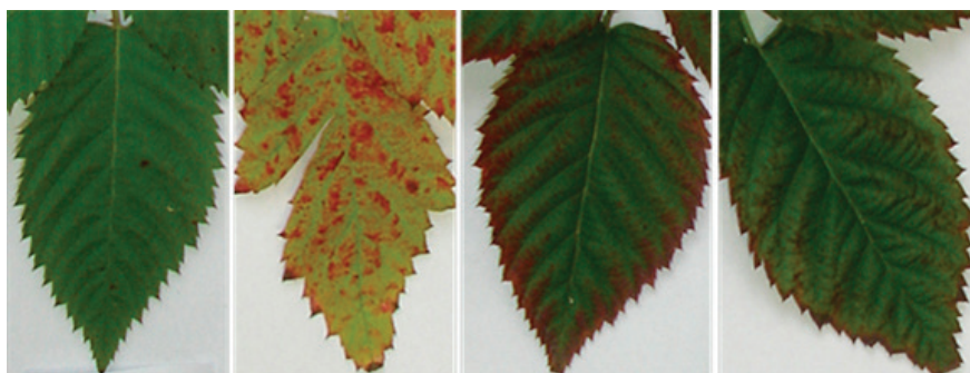
FIGURA 3- Sintomas de deficiência de moderada (A) e severa (B) de nitrogênio; de fósforo (C), e de potássio (D), em folhas de amoreira-preta.