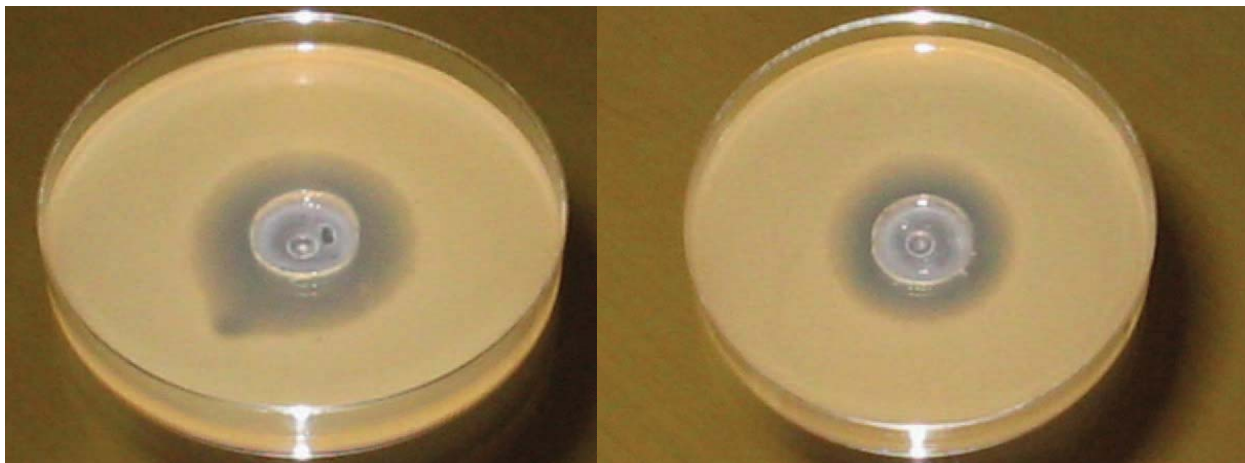
Figura 1. Halo de inibição para Staphylococcus aureus (esquerda) e para Escherichia coli (direita), em meio contendo óleo de melaleuca.