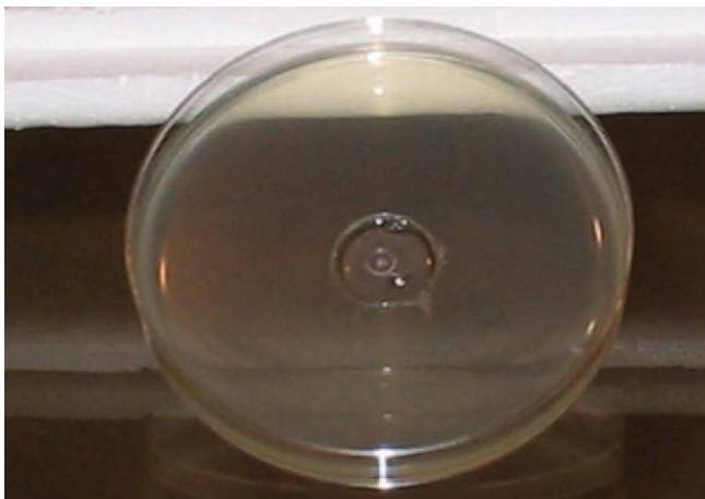
Figura 3. Efeito fungistático do óleo de alecrim frente a Candida albicans .