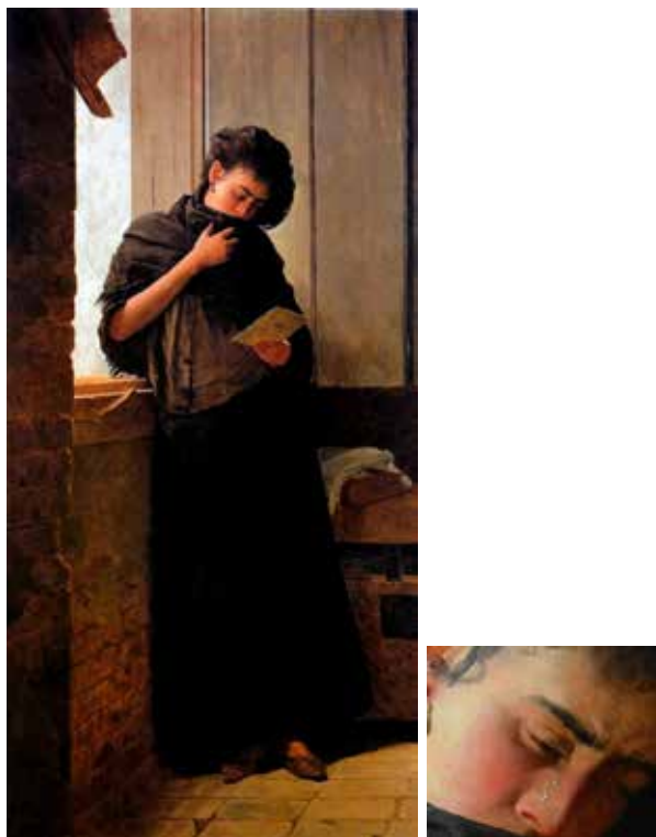
Figura 1 – Almeida Júnior, Saudades , 1899. 197 x 101 cm. Pinacoteca do Estado de São Paulo.