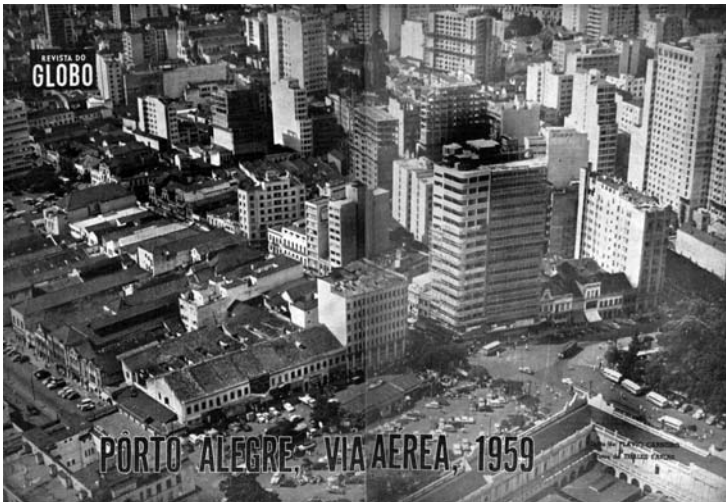
Foto 3 – CARNEIRO, Flávio; FARIAS, T. Porto Alegre via aérea, 1959. Revista do Globo , 1959, n.742, p.10-1.

Mas não há somente publicidade da modernização ou a venda de uma imagem da cidade para consumo dos leitores de classe média na Revista do Globo . Ela também cumpria o papel de apontar os dilemas que a cidade en-