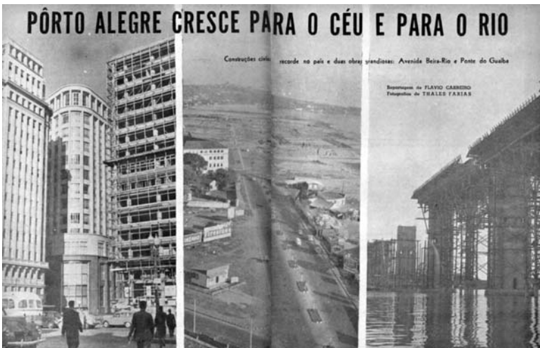
Foto 1 – CARNEIRO, Flávio; FARIAS, Thales. Porto Alegre cresce para o céu e para o rio. Revista do Globo , n.722, 1958, p.38-9.

Na fotorreportagem “Porto Alegre cresce para o céu e para o rio”, 20 com fotos de Thales Farias, o processo de modernização é o tema central, com tomadas fechadas do centro da cidade colocando em destaque os novos edifícios (verticalização), bem como as obras da Avenida Beira-Rio (expansão do perímetro urbano) e da ponte sobre o Guaíba (nova escala de construções e ligação entre o sul rural e o norte urbano do estado), o que é enfatizado pelo título e pelo subtítulo da fotorreportagem: “Construções civis: recorde no Brasil e duas obras grandiosas”. São dez fotos de meia página, com o predo-