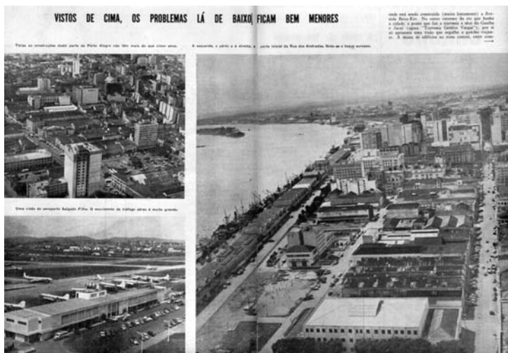
Foto 4 – CARNEIRO, Flávio; FARIAS, T. Porto Alegre via aérea, 1959. Revista do Globo , 1959, n.742, p.14-5.

frentava e deveriam mobilizar a opinião pública e a vontade das administrações municipal e estadual para a sua resolução.